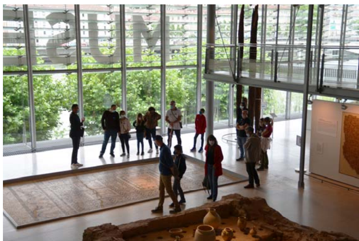
G. Maroni©Musée gallo-romain Saint-Romain-en-Gal